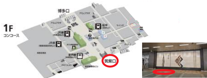
博多駅 筑紫口 外に出たところ